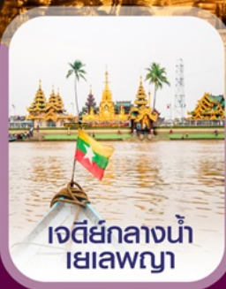
เจดีย์กลางน้ำ เยลพญา

เชิควิน อย่างกุง สีเรียม พระมหาเจดีย์ชเวดากอง ไหว้พระ 5 วัด เสริมบุญ ต้อนรับศักราชใหม่