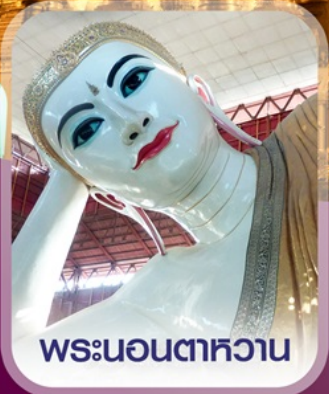
พระนอนตาทาวน