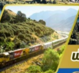
นั้รงรถไฟทรานซ์ อัลไพน์