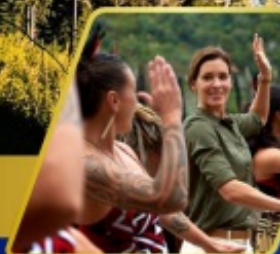
หมู่บ้านเมารี