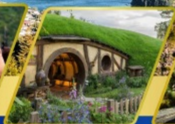
บ้านฮอบบิต