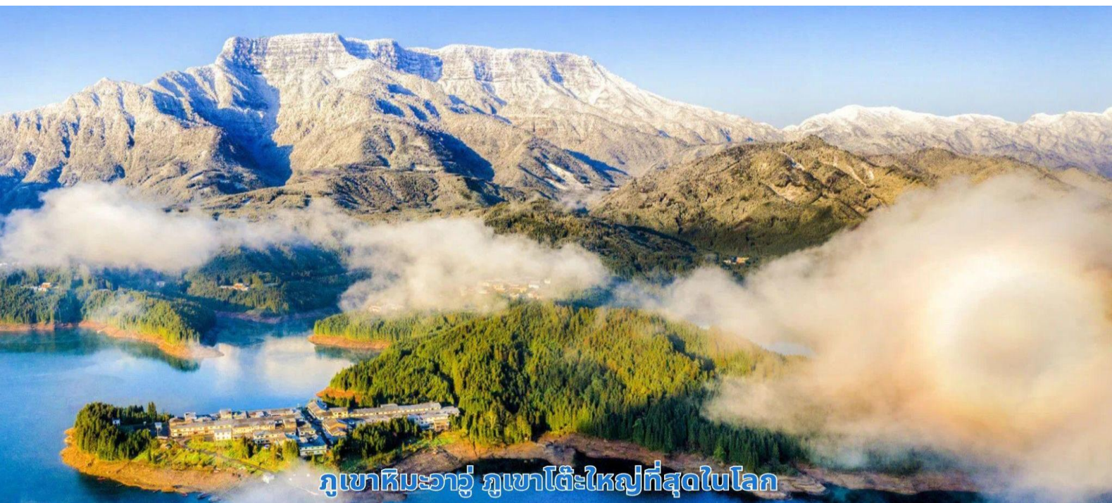
ภูเขาหิมะวาวู ภูเขาโต๊ะใหญ่ที่สุดในโลก

บ่าย จากนั้นนำท่านเดินทางกลับเข้าสู่เมืองเฉิงตู