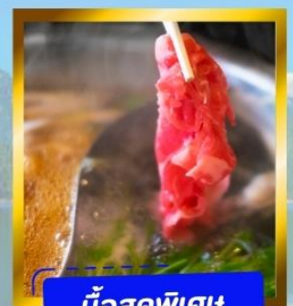
มือสุดพิเศษ