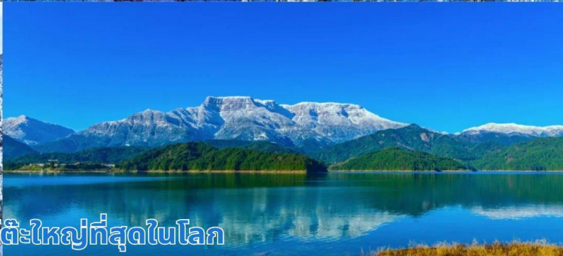
ภูเขาหิมะวาวู ภูเขาโต๊ะใหญ่ที่สุดในโลก