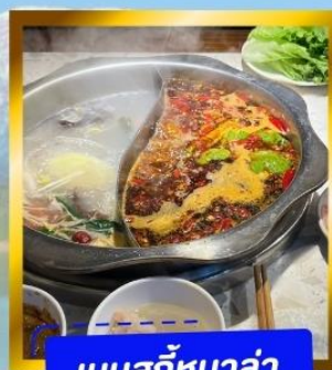
เมนูสุกี้หม่าล่า