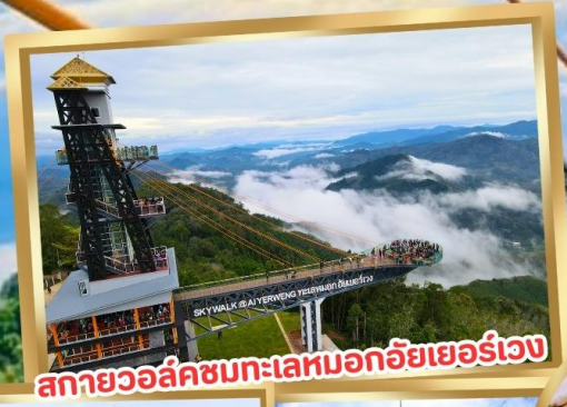
สกายวอล์คชมทะเลหมอกอัยเยอร์เวง

ร่วมโครงการ ลดหย่อนภาษี ลดสูงสุด 15,000.-