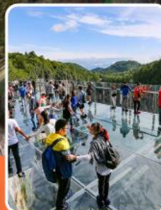
ระเบียงแก้วอุ๋หลง