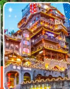
หงหยาดัง

เที่ยวฟิน 3 มรดกโลก เช็คอินครบทุกจุดไฮไลต์ !!