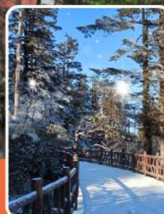
ภูเขาหว่าอูซาน