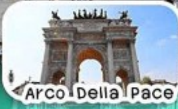
Arco Della Pace

เที่ยว มิลาน-เจนัว-ปิซ่า-ฟลอเรนซ์- โบโลญญา-โคโม ดื่มด่ำบรรยากาศสวยงามริมทะเลสาบโคโม ชมหอเอนปิซ่าและมหาวิหารแห่งฟลอเรนซ์ ชิมพิซซ่าและพาสต้าสดอิตาเลียนแท้ๆ ช้อปปิ้งแบรนด์ดังอย่างจุใจที่มิลาน Galleria Vittorio Emanuele II แถม: Fidenza Village Outlets