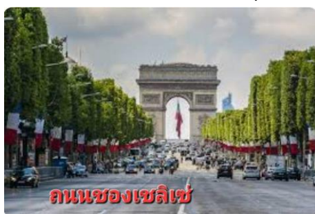
ถนนของเซลิเซ่