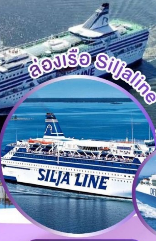
ล่องเรือ Siljaline

ล่องเรือและพักบนเรือสำราญ SILJALINE ล่องเรือและพักบนเรือสำราญ DFDS SEAWAY มีบินภายในไม่ต้องนั่งรถไกล