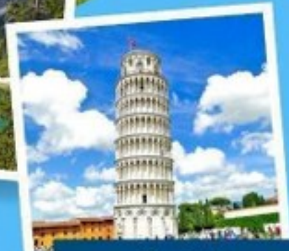
เมืองปิซ่า