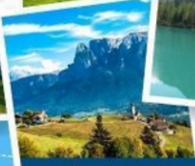
เมืองโบลซาโน