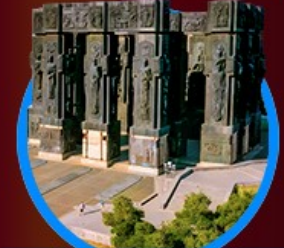
อนุสาวรีย์ประวัติศาสตร์

48,888 23-28 ต.ค. 67 เหลือ 10 ที่ 41,111