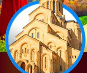
โบสถ์กรินดี เมืองทบิลีซี