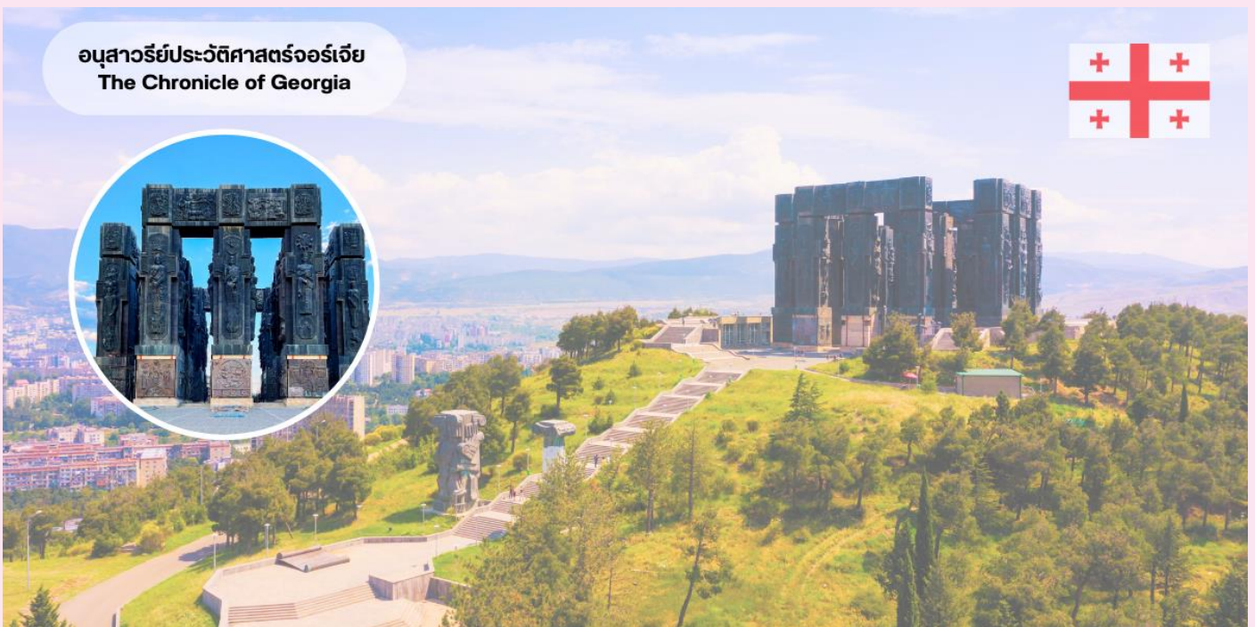
อนุสาวรีย์ประวัติศาสตร์จอร์เจีย The Chronicle of Georgia

ชมความอลังการเสวยักษ์ และย้อนรอยประวัติศาสตร์จอร์เจีย “อนุสรณ์ประวัติศาสตร์จอร์เจีย” ได้ชื่อว่าเป็น “ Stonehenge of Georgia “