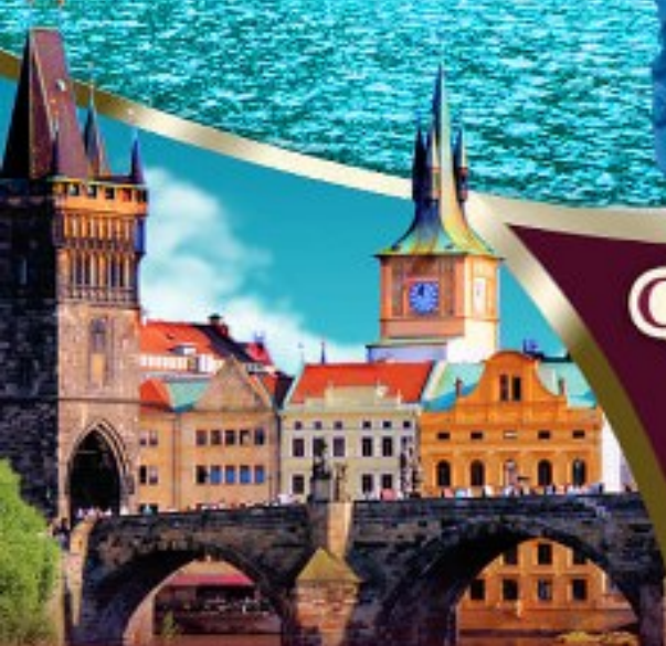
Charles Bridge -czech-