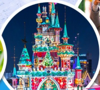
สวนสนุกค็อดเต้