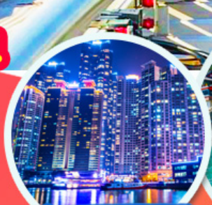
The Bay 101