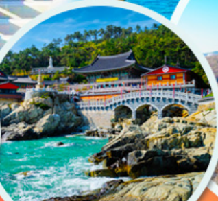
วัดแฮดง ยงกุงซา