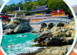
วัดแฮดง ยงกุงซา