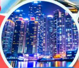
The Bay 101