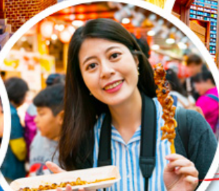
ตลาดควางจ้ง