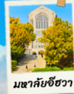
มหาชัยชีวา