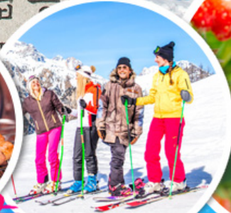
เล่นสกีจุใจ