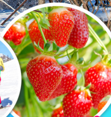
ไร่สตรอว์เบอร์รี่