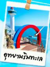
อุทยานริมหาด