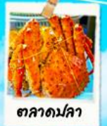
ตลาดมดดา