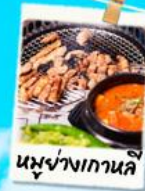
นึ่งข้างเกาหลี