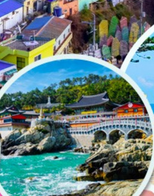
วัดแฮดง ยงกุงซา