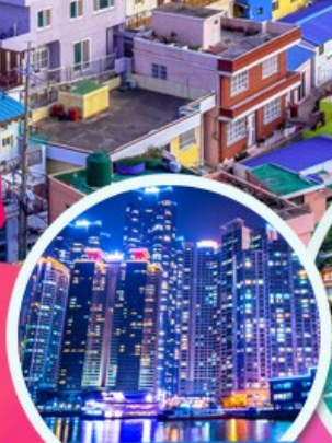
The Bay 101