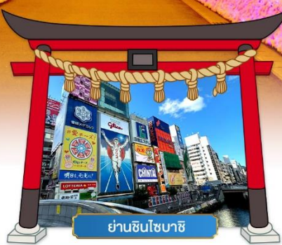
ย่านชินไซบาชิ