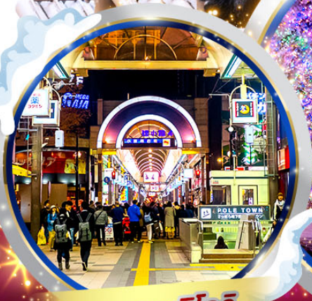
ถนนทานุกิโคจิ