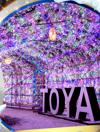
เทศกาลประดับไฟไทยะ