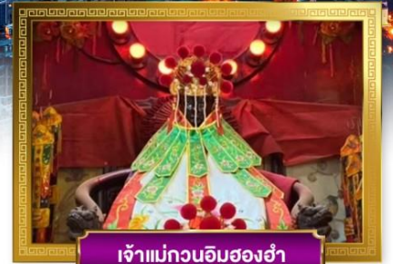
เจ้าแม่กวนอิมสองฮ่า