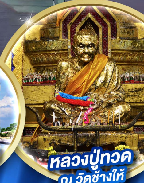
หลวงปู่ทวด ณ วัดช้างให้