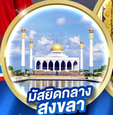
มัสยิดกลาง สงขลา