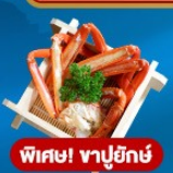
พิเศษ! ชาบูยักษ์