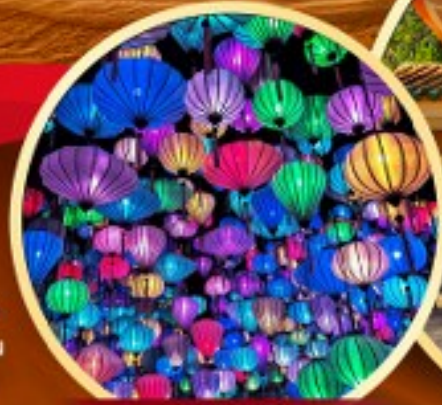
สวนแห่งแสง (Lumiere Light Garden)