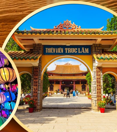
สวนแห่งแสง (Lumiere Light Garden)