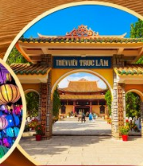
วัดตึกลัม