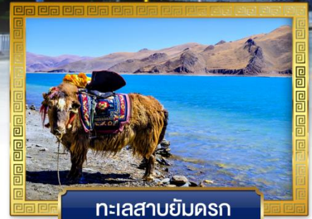
ทะเลสาบยัมดรก

เดินทางโดย: สายการบินลัคกี้แอร์ & โซน่อีสเทิร์นแอร์ไลน์