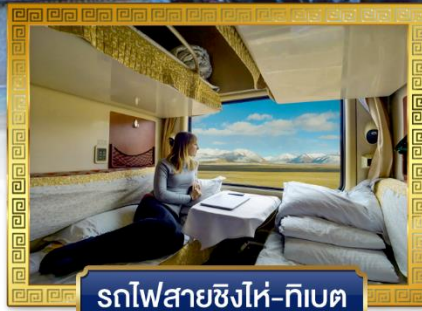
รถไฟสายชิงไห่-ทิเบต