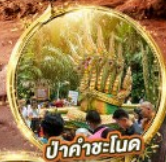
ป่าคำชะโนด