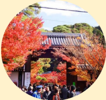
จุดประตูโชมง เป็นประตูทางเข้าหลักของวัดเอคันโด

นำท่านเยี่ยมชม วัดเอคันโด หรือที่รู้จักกันอีก 3 ชื่อ อาทิ เซนรินจิ โชจูโรงะซัง และมูเรียวจูอิน วัดแห่งนี้ตั้งอยู่ทางฝั่งใต้ของ ทางเดินนักปราชญ์ (Philosopher's Path) ตรงใจกลางเมืองฮิงาชิยามะ พื้นที่ตรงนี้กว้างใหญ่โดยมีอาคารมากมายที่เชื่อมถึงกันด้วยทางเดินแบบมีหลังคาคลุม วัดแห่งนี้คือของขวัญที่ขุนนางตุลาการในสมัยเออัน (ปี 794-1185) มอบให้พระสงฆ์ ภายในวัดเต็มไปด้วยงานศิลปะหลากหลายชิ้น โดยชิ้นที่มีชื่อเสียงที่สุดคือรูปปั้นพระอมิตาพุทธ ซึ่งพระเศียรหันไปด้านหนึ่งแทนที่จะมองตรงมาทางด้านหน้าอย่างที่เห็นกันตามปกติ ตำนานเล่าไว้ว่าขณะที่เจ้าอาวาสประกอบพิธีสำหรับพระพุทธรูปองค์นี้ ท่านได้เห็นมามองและพูดคุยกับเจ้าอาวาส อีกทั้งยังเป็นวัดที่รู้จักกันดีว่ามีใบไม้ที่สวยงามมีชื่อเสียงในการชมใบไม้เปลี่ยนสีในช่วงฤดูใบร่วงตอนประมาณปลายเดือนพฤศจิกายนถึงต้นเดือนธันวาคม โดยจะงดงามมากขึ้นไปอีกจากแสงที่มาจากกระทะพวยมเย็นภายในวัดมีมุมถ่ายรูปกับใบไม้เปลี่ยนสีมากมาย อาทิ