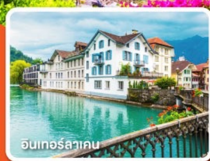
อินเทอร์ลาเคน