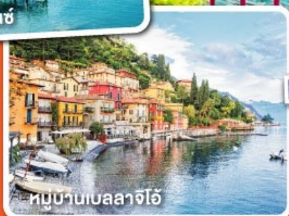
หมู่บ้านเบลลาจิโอ