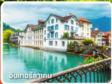
อินเทอร์ลาคอน