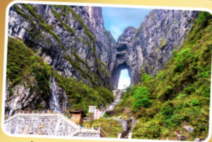
ประตูสวรรค์ เทียนเหมินซาน