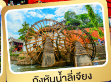
กังหันน้ำลี่เจียง