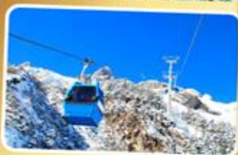
กระเช้าใหญ่ขึ้นภูเขาหิมะมังกรหยก