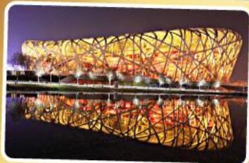
สนามกีฬาโอลิมปิก