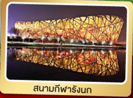
สนามกีฬารังนก