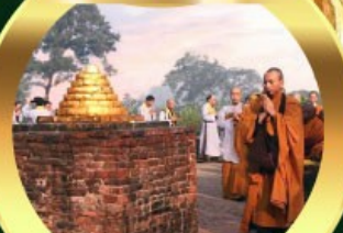
เขตวันมหาวิหาร เมืองสาวัตถี