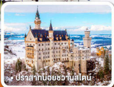
ปราสาทน้อยหวานสไตน์