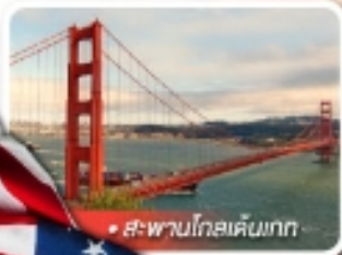
สะพานโกลเด้นเกต