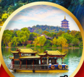
ทะเลสาบซีหู