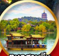
ทะเลสาบซีหู