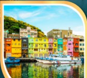
ท่าเรือเจิ้งปิน