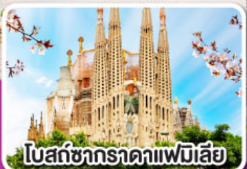
โบสถ์ซากกราดาแฟมิเลีย