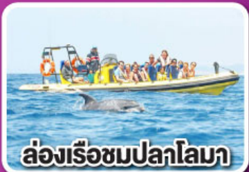
ล่องเรือชมปลาโลมา