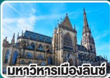
มหาวิหารเมืองลินซ์