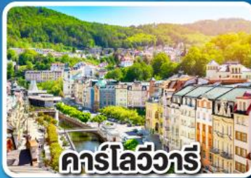
คาร์ลส์บัท