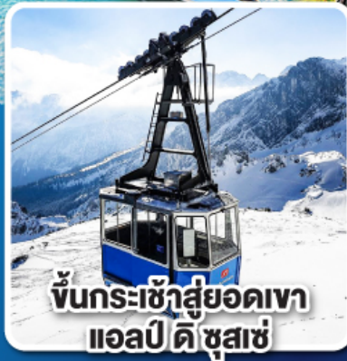
ขึ้นกระเช้าสู่ออดเขา แอลป์ ดิ ชูสแซ่

เที่ยวเมืองอินส์บรุค เพชรเม็ดงามสุดโรแมนติก แห่งแคว้นทิโรล ราคาเริ่มต้น