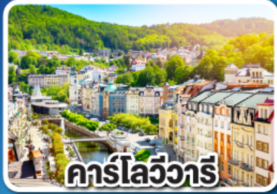
คาร์โลวารี