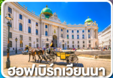
ฮอฟบิรทเวียนนา