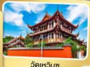
วัดเหวินชู่