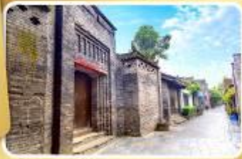
ถนนโบราณชอยกวางชอยแค