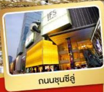
ถนนชุนชี่ลู่