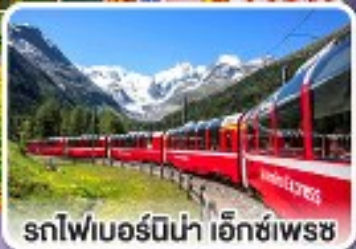
รถไฟเบอร์นีนา เอ็กซ์เพรส

รถไฟสายโรแมนติกและยอดเขาสุดพีคสุด อิตาลี สวิตเซอร์แลนด์ ออสเตรีย สโลวาเกีย 10 วัน 7 คืน