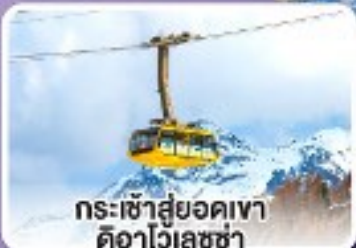
กระเช้าสู่ยอดเขาดืออาไวเลซซา