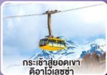
กระเช้าสู่ยอดเขา ดืออาไวเลซซา