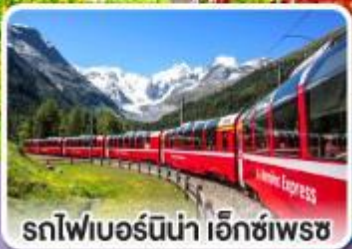
รถไฟเบอร์นีนา เอ็กซ์เพรส