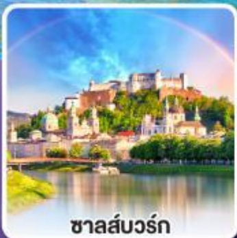
ซาลส์บวร์ก