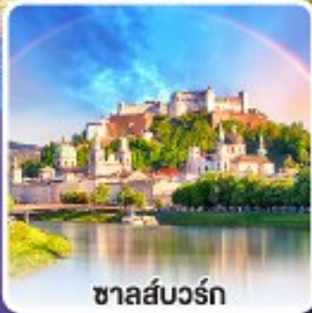
ซาลส์บวร์ก