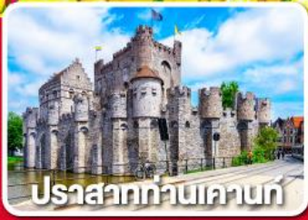
ปราสาทท่านเคานท์