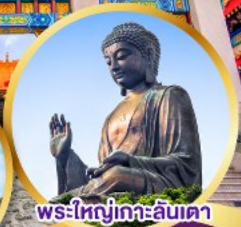
พระใหญ่เกาะลันเตา