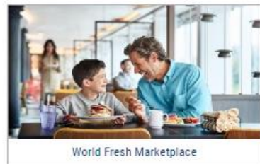
World Fresh Marketplace