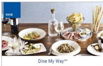
Dine My Way™

Indulge your appetite whenever you wish on board Princess®. Every hour, our chefs are busy baking, grilling and sautéing great-tasting fare from scratch. Princess offers unparalleled inclusive dining options throughout the ship with a wide range of culinary delights to suit any palate, from endless buffet choice to gourmet pizza, frosty treats, decadent desserts and much more.!