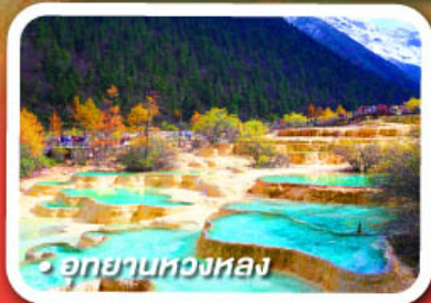
อุทยานหวงหลง