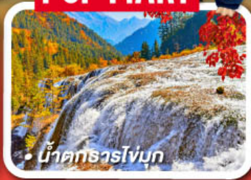
น้ำตกธารโง่บูก