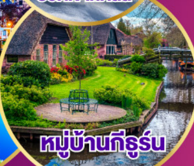
หมู่บ้านทีร์รุน

เดินทาง 30 เม.ย.-09 พ.ค. 68 03-11 พ.ค. 68