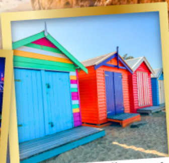
ไบรด์ตัน บาร์ตัง บ็อกซ์

03-10, 12-19 เม.ย.68 24 เม.ย.-01 พ.ค.68 08-15, 22-29 พ.ค.68 29 พ.ค.-05 มิ.ย.68