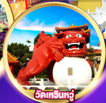
วัดเหวินหู่