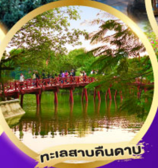
ทะเลสาบคินคาบ