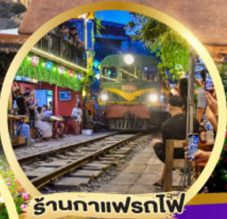
ร้านอาหารไฟร์ไฟ