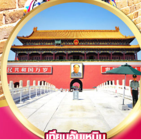
เทียนอันเหมิน